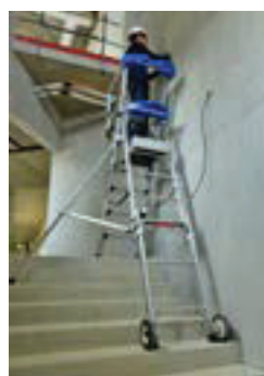
Installation en dénivelés.